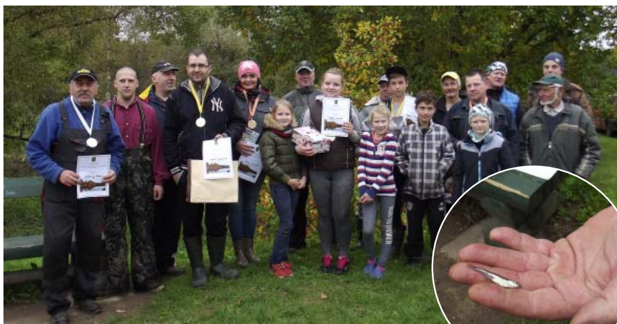
Sacensību dalībnieki un uzvarētāji.

Kā jau nu ir ierasts pulcēšanās notika pie Kalsnavas pamatskolas. Piedalīties varēja pilnīgi visi makšķerēšanas entuziasti gan arī sava amata lietpratēji, protams, ievērojot pēc likuma noteiktās prasības, grupā bērni un jaunieši līdz 16 gadiem, pavisam desmit dalībnieki, grupā vīrs 16